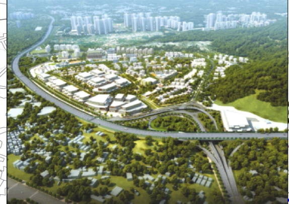
洪水橋新發展區連接至西鐵天水圍站的環保運輸服務示意走線 (正進一步研究)

減少空氣及噪音影響 一 位於唐人新村的就業帶將提供本地就業機會及減少到市區的對外交通，而貨運交通亦毋須穿梭於具發展潛力區內的住宅社區。 一 具發展潛力區內的住宅用地將與元朗公路及其他具發展潛力區內的道路設有適當的分隔距離。