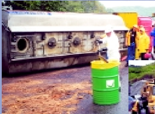
化學廢物處理中心的緊急應變隊伍清理運油車翻側意外漏出的油污