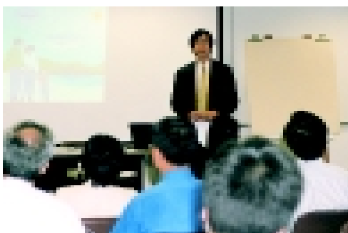
環保署為 460 名政府官員舉辦環保工作報告的培訓