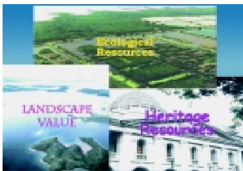
環保署督導《二十一世紀可持續發展研究》的「環境基線研究」，協助推廣可持續發展的概念

我們深明必須增進企業對環境保護工作的責任感和使命感，好讓他們自發地改善環保表現，承輔香港的可持續發展。