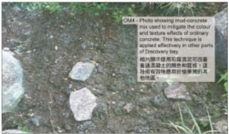
景觀緩解措施 相片 Landscape Mitigation Measures PHOTOS