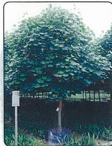
Hibiscus tiliaceus (黃槿)