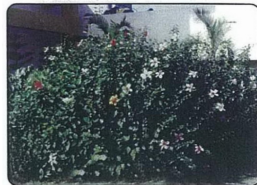
Hibiscus rosa-sinensis (紅葉大紅花)