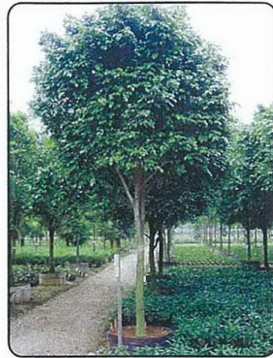
Ficus benjamina (垂葉榕)