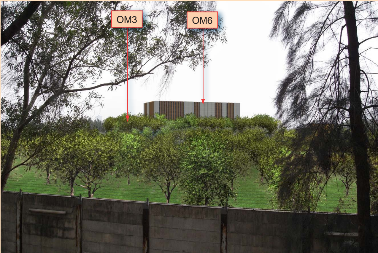
10 Years with Mitigation Measure