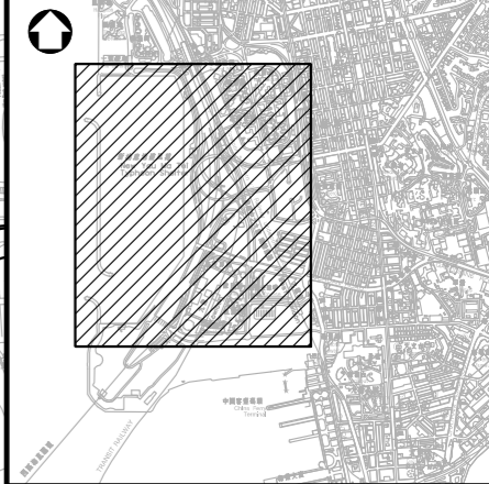
位置圖 LOCATION PLAN 比例 SCALE 1:10000