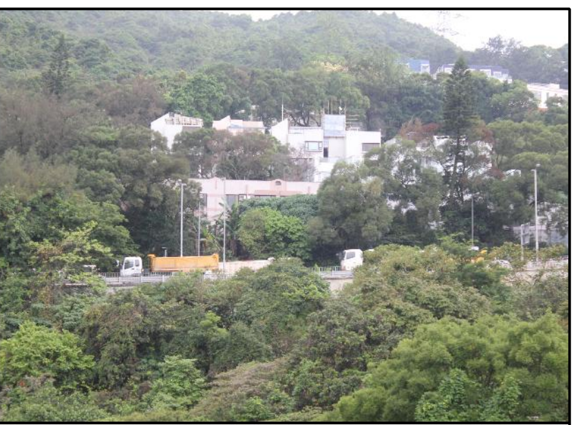
LCA2 RURAL FRINGE LCA