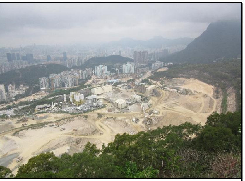
LCA6 QUARRY LCA