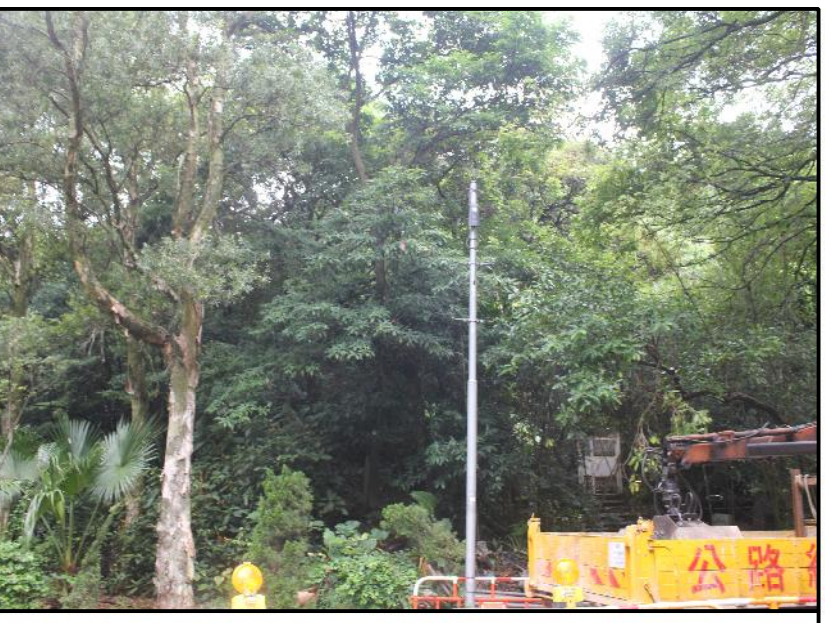
LCA1 PEAKS, UPLANDS AND HILLSIDES LCA

Plot File by: ZHONGDY PATH P:/PROJECTS/60