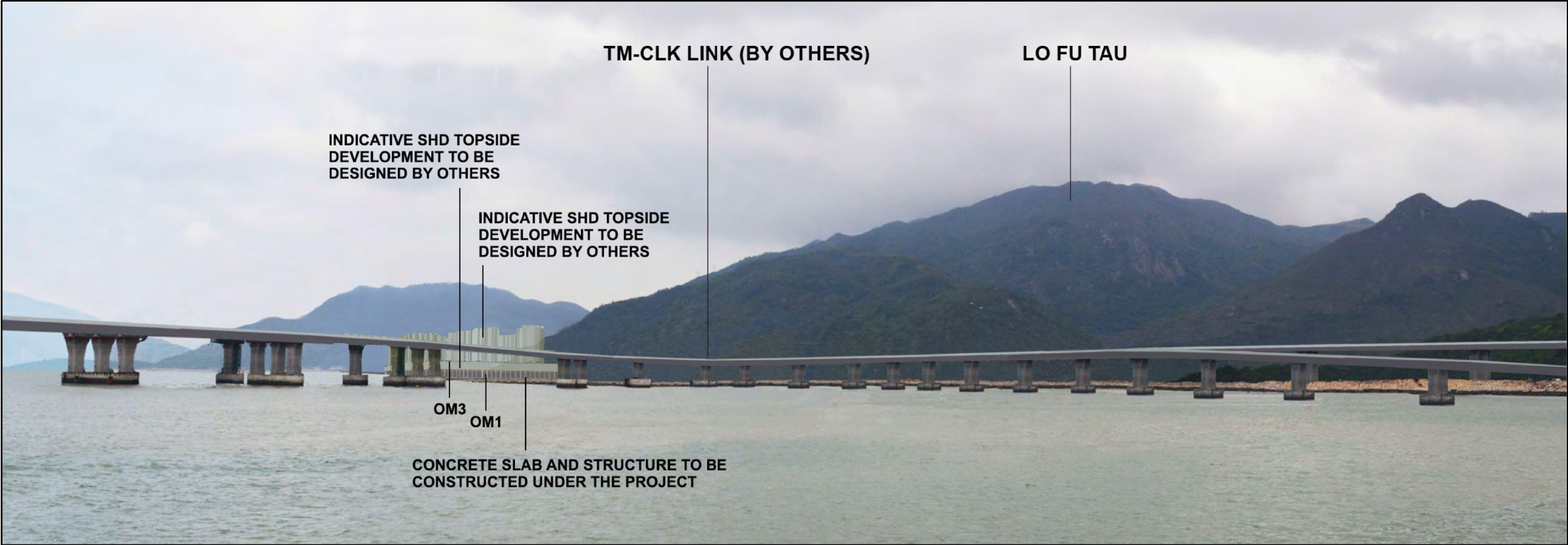
DAY 1 WITH MITIGATION MEASURE

P:\Project\160493798\01 CAD ADMIN\02 LAYOUT\01 PLOT DRIVER\13 BW COL SYSTEM ST01.PLT PLOT DATE: 20/6/2011 8:56:55 PLOT BY: K. K. K. PLOT NAME: 160493798\01 CAD ADMIN\02 LAYOUT\01 PLOT DRIVER\13 BW COL SYSTEM ST01.PLT