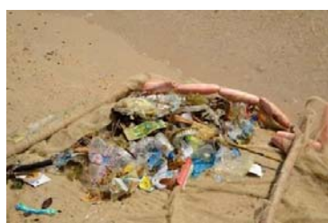
憲報公布的公眾泳灘