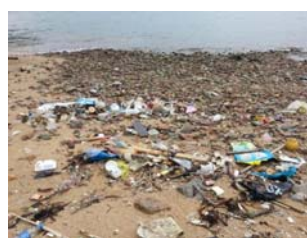
非憲報公布的泳灘