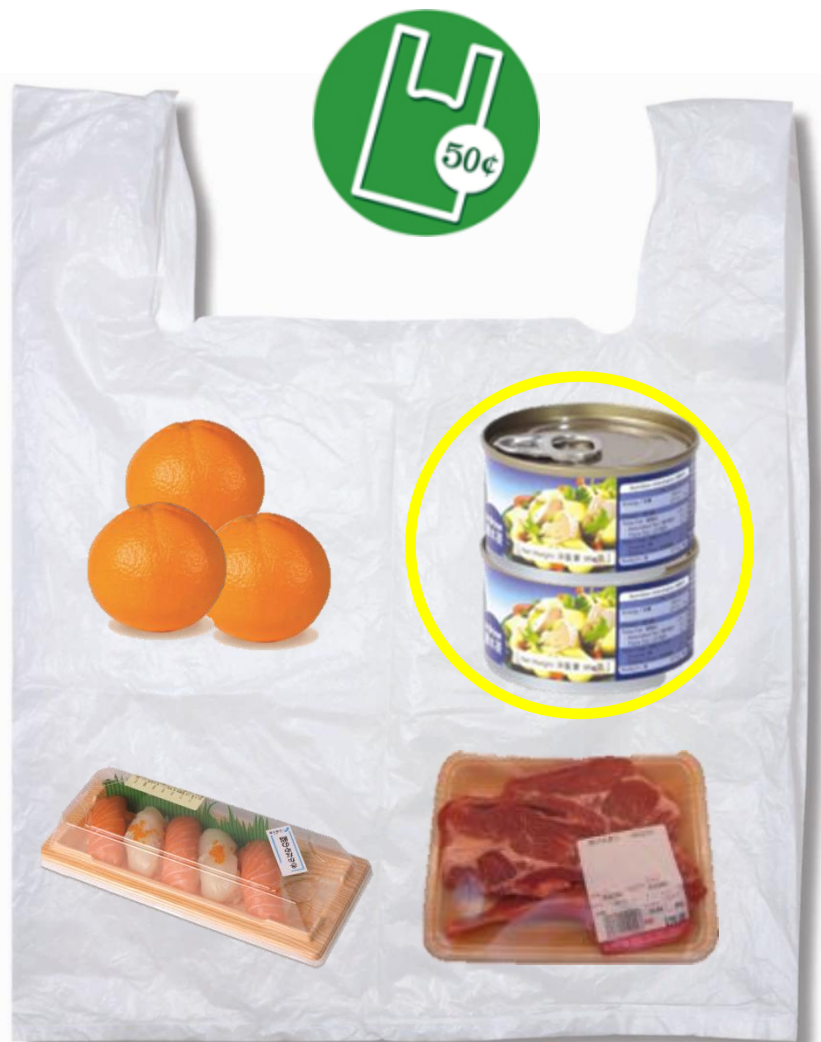
與氣密包裝的食品混合一起盛載