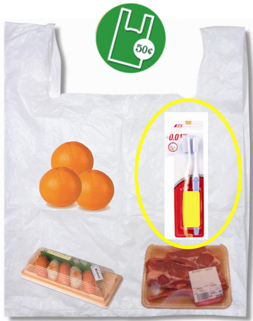
與非食品混合一起盛載