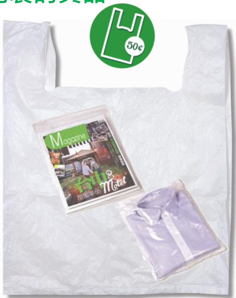
構成貨品一部分的袋