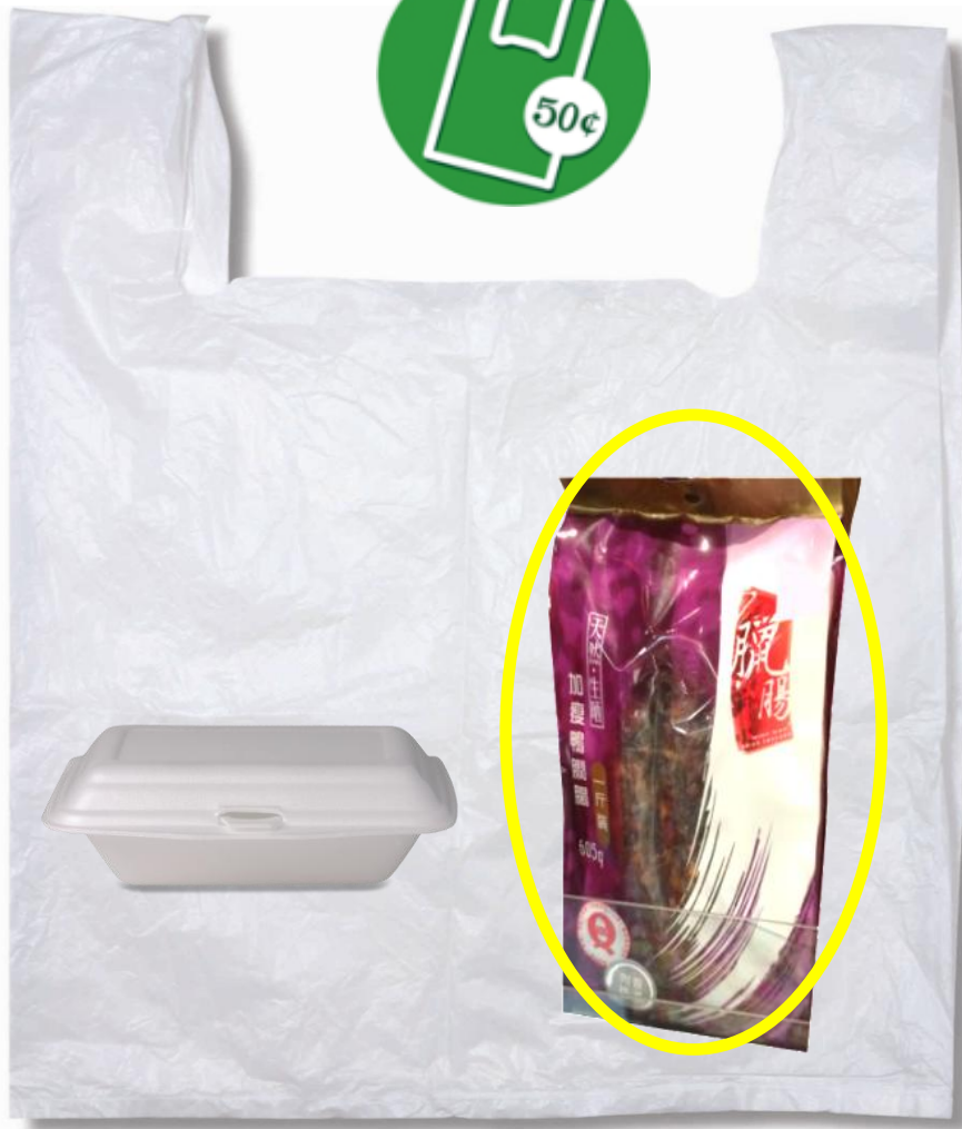
與氣密包裝的食品混合一起盛載