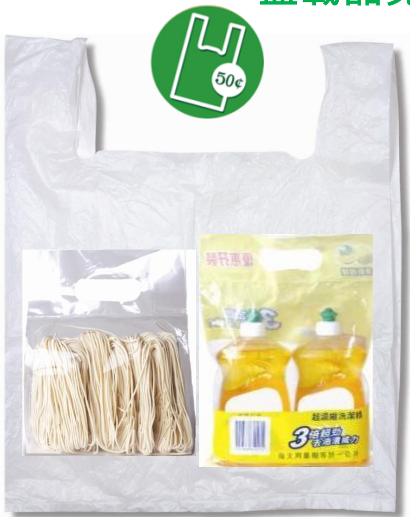
預先密封的包裝袋