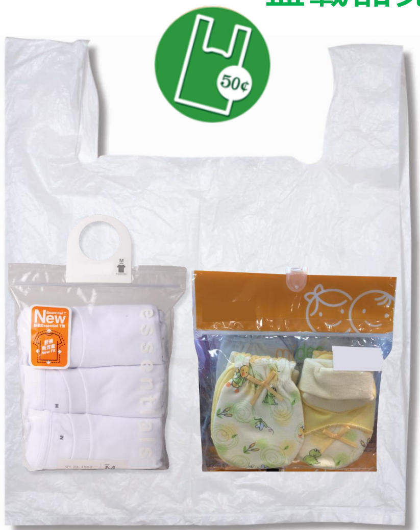
預先密封的包裝袋