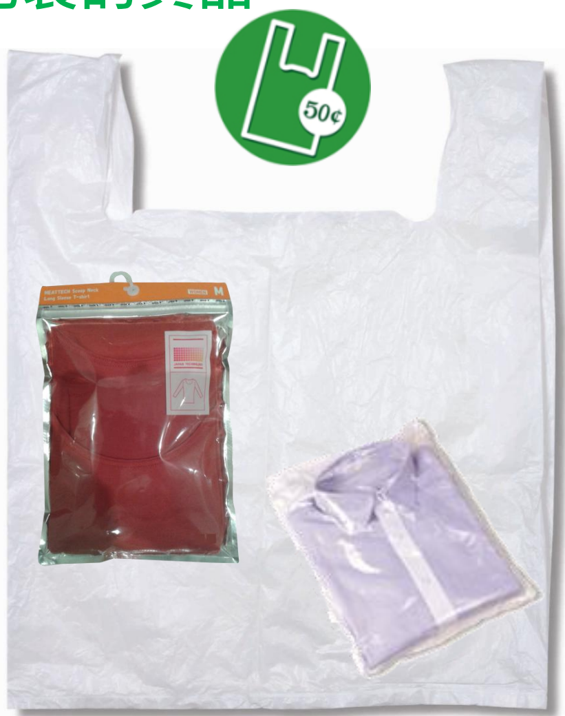
構成貨品一部分的袋