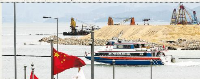
圖為機場海天碼頭往返內地的高速船，按機管局規定，當駛經沙洲及龍鼓洲海岸公園以北區域時，須限速 15 海裡或以下，以保護白海豚。

註：今年內大嶼山海域出沒的白海豚數量暫只顯示至3月，由於海豚出沒受季節影響，本報比較過往兩年的同期數字，以得出較客觀結果