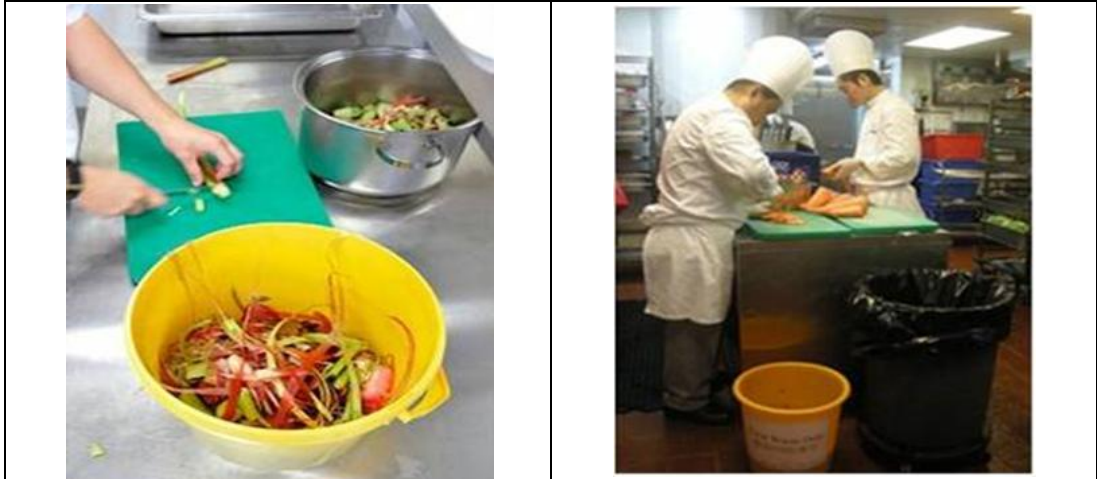
圖 8 - 餐前廚餘分類

餐後廚餘一般需靠人手分類，清潔員工應將廚餘和惰性物質分別放於兩個不同的容器內（見圖9）。對於需處理大量餐後廚餘的廚餘產生者，例如餐飲服務供應商和食品製造商，建議使用半自動輸送帶系統協助將廚餘分類。