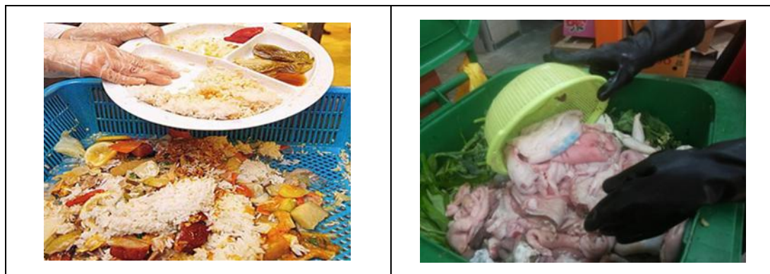
圖 10 - 使用隔篩將廚餘中含過多的水份隔去

請注意： 洗碗後所收集到的廚餘，並不適合用作廚餘回收再造，因殘留在廚餘中的清潔劑會影響厭氧分解過程。