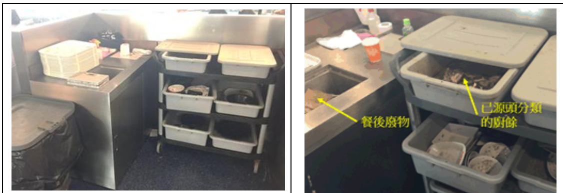
圖 9 - 使用不同容器有助餐後廚餘分類

為避免廚餘中含有過多的水份，例如糖漿和湯，應使用隔篩將多餘的水份盡量瀝乾排走，以方便廚餘收集和運送（見圖10）。