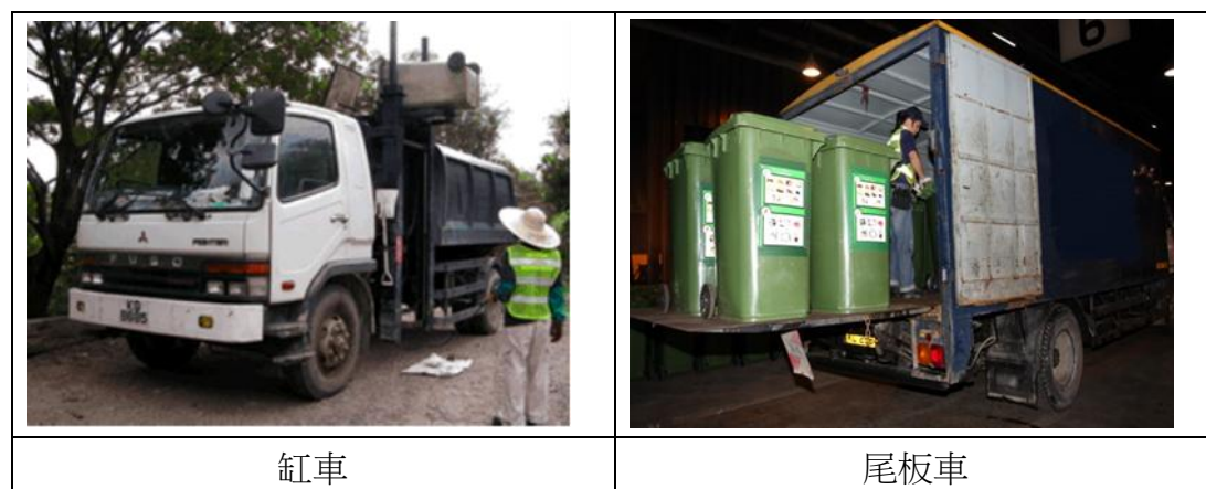
圖 15 - 廚餘收集車輛的種類