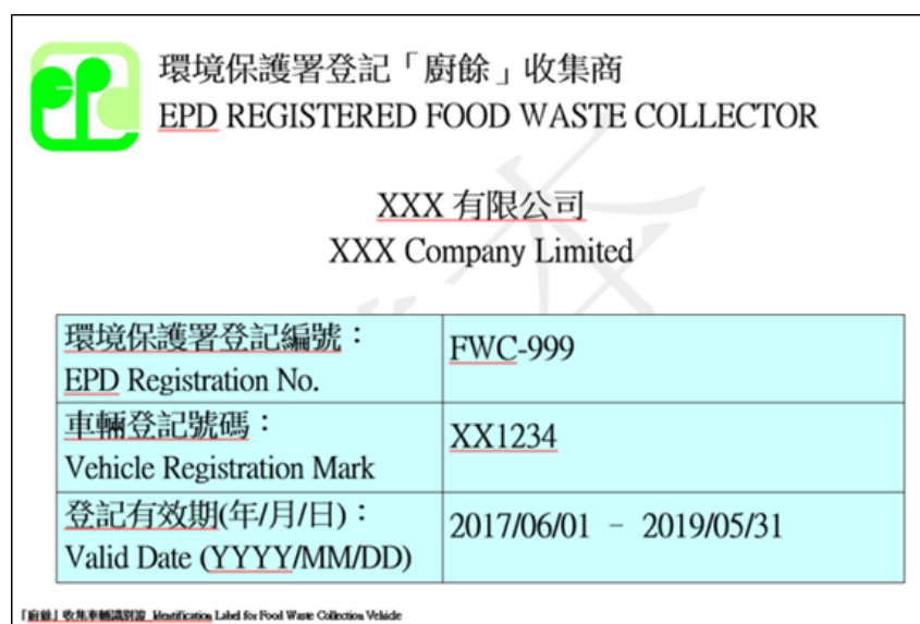
圖 16 - 廚餘收集商的車輛識別證

成功向環保署登記的廚餘收集商，會獲發已過膠的廚餘收集車輛識別證（見圖 16）。識別證應展示於收集車輛擋風玻璃左下角的顯眼位置。沒有識別證的車輛將不允許進入回收中心第 1 期。