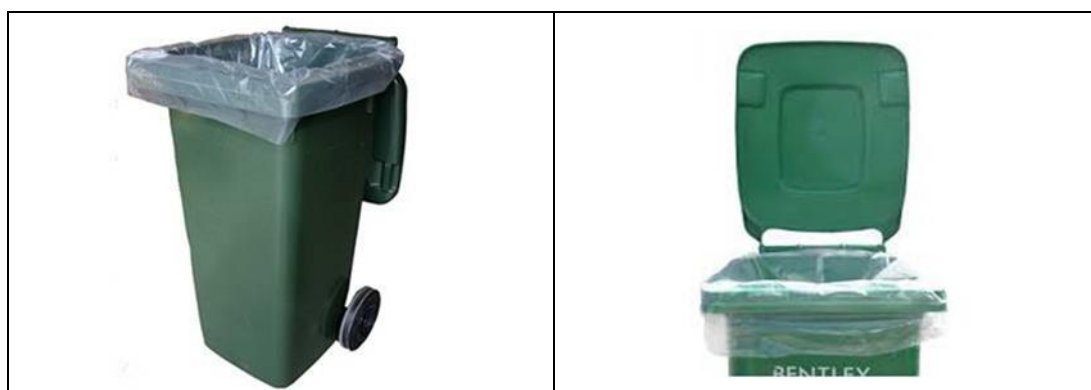
圖 12 - 可分解的透明膠袋（例子）

https://www.wastereduction.gov.hk/tc/household/Supplier_List.htm