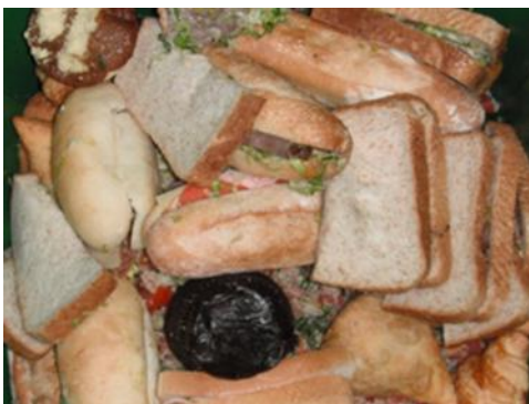
麵包、蛋糕、餅乾及甜品