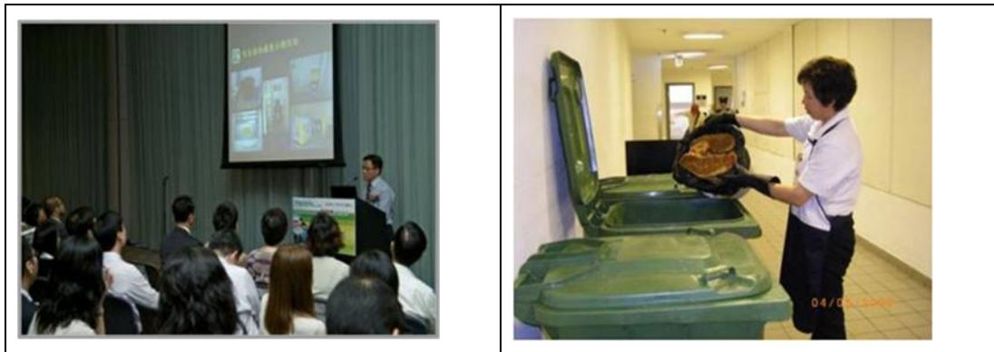
圖 5 - 環保署提供不同類型的支援給主要持份者

為協助並支持工商業機構切實執行正確的廚餘源頭分類、收集和運送至回收中心第 1 期進行循環再造，環保署會向參與的工商業機構之管理層以至前線工作人員提供技術支援，並透過簡介會、培訓和實地考察等講解廚餘源頭分類的方法、收集與運送物流安排等（見圖 5）。