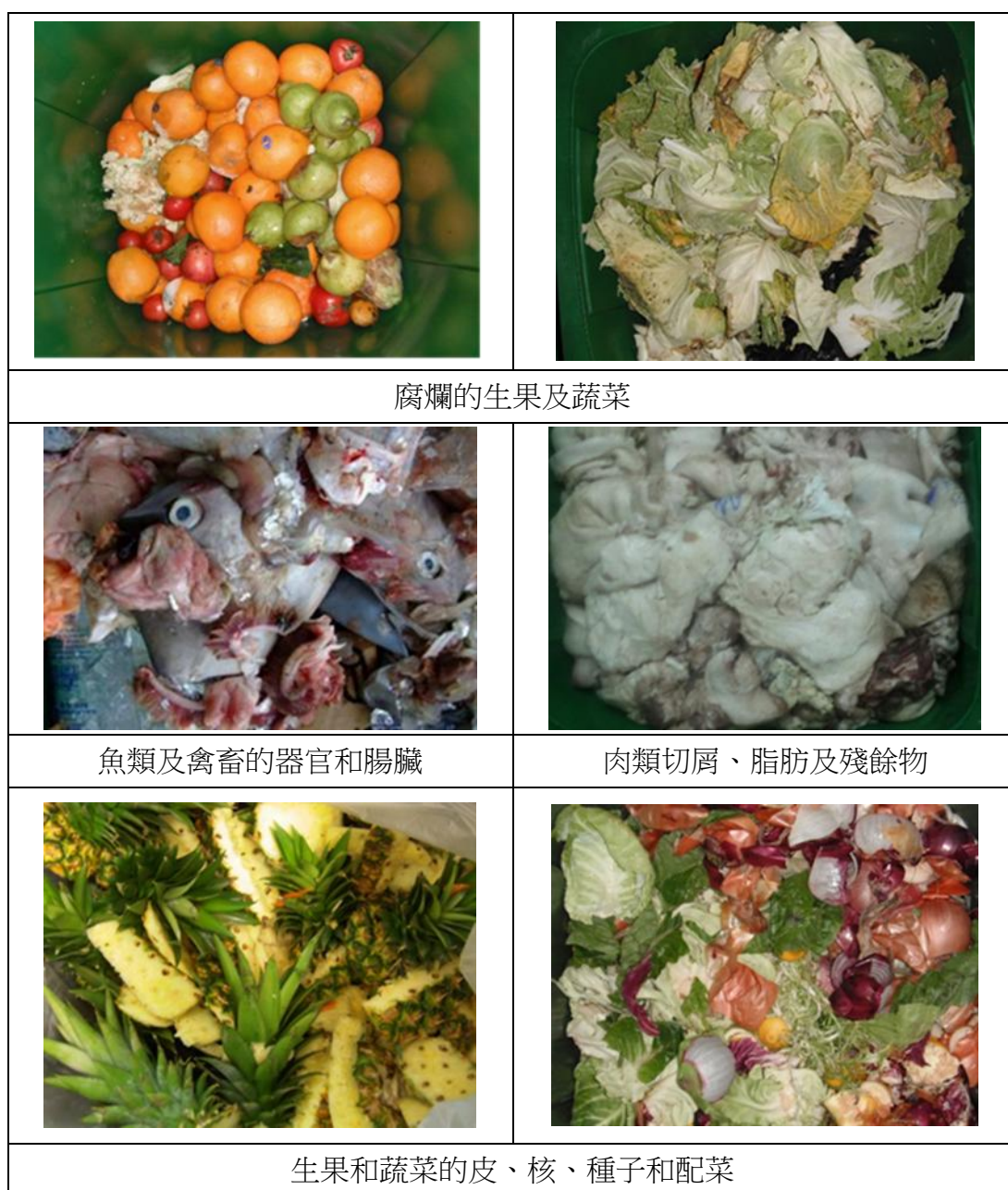
圖 1 - 已源頭分類廚餘 (例子)

廚餘 是指任何在食物製作、分發、貯存及預備膳食或用膳過程中產生的廢物，包括生／熟食物、可食用及不可食用的部分。 源頭分類廚餘 包括餐前廚餘及餐後廚餘(見圖 1)，都是從都市固體廢物中源頭分類出來。有效的源頭分類是保障優質廚餘運送至回收中心第 1 期的一個先決條件。