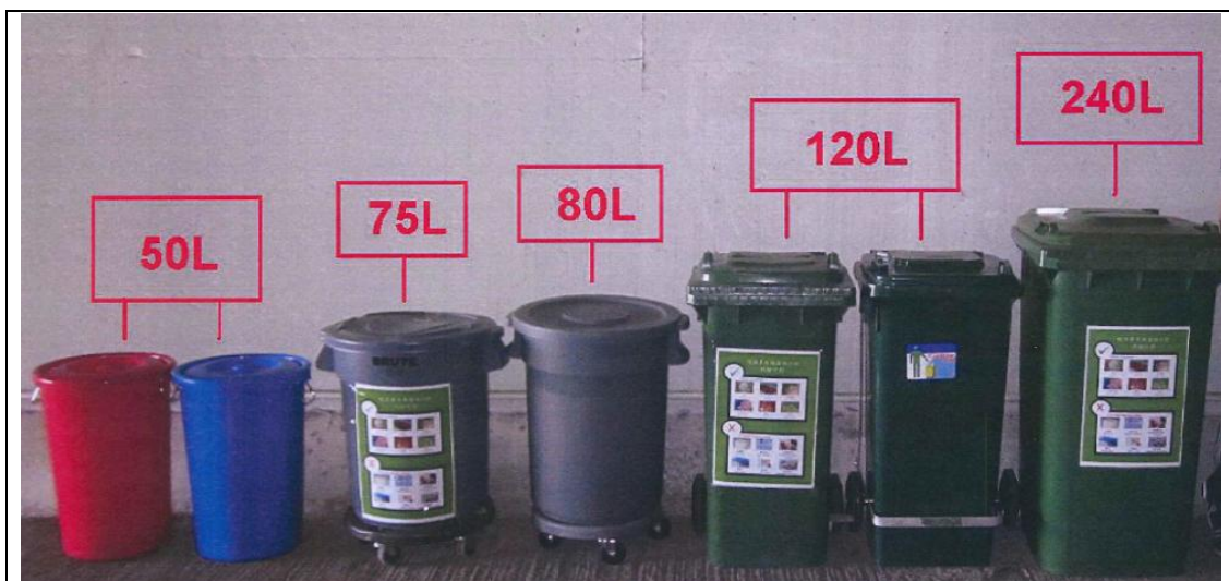
圖 11 - 適當的廚餘收集桶（例子）

基於環境原因，我們不建議廚餘產生者使用膠袋盛載廚餘。然而，若由於衛生或操作原因而不可避免使用膠袋盛載，我們建議廚餘產生者使用透明並可分解的重型膠袋盛載和運送廚餘（如圖 12 所示），既可免廚餘溢漏，亦有助於廚餘收集商在收集和運送廚餘前能進行適當的目測檢查。另外，不應使用紅色或黃色的膠袋，以免與標準的醫療廢物袋混淆。如廚餘收集商/ 廚餘產生者有意採用膠袋盛載廚餘，並有意使用綠色採購，可參考以下兩個互聯網超連結，內載一些環保採購及部分本地可降解膠袋供應商名單（未經政府特別認可）：