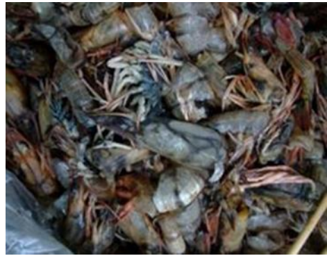
肉類、魚類、魚鱗、有殼海產、貝殼及小型骨頭