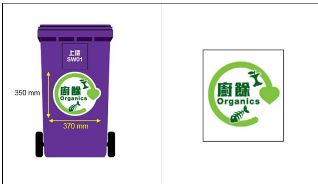
圖 13 - 廚餘收集桶標識（待定）

每個貯存廚餘的收集桶均須貼上一個正確的標識，如圖 13 所示，以區分廚餘收集桶及都市固體廢物箱。標識可向環保署查詢及索取，並必須穩妥地貼於收集桶上的顯眼位置，以確保標識上的資料清晰易見。建議廚餘收集商為每個廚餘收集桶編製參考號碼，以便記錄廚餘的重量/ 數量。