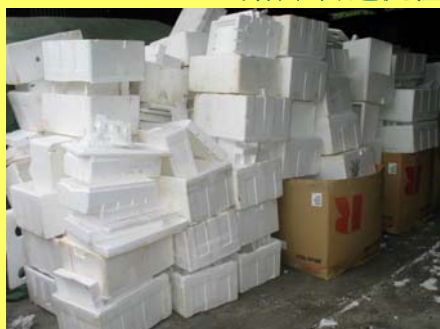
經清潔的泡沫聚苯乙炔包裝廢料