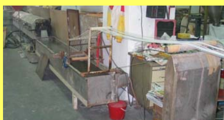
拉粒成爲循環再造的聚苯乙炔原料