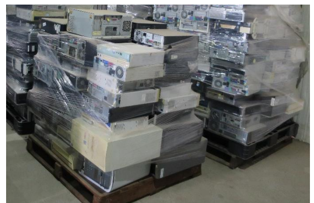
可持續使用的二手電腦