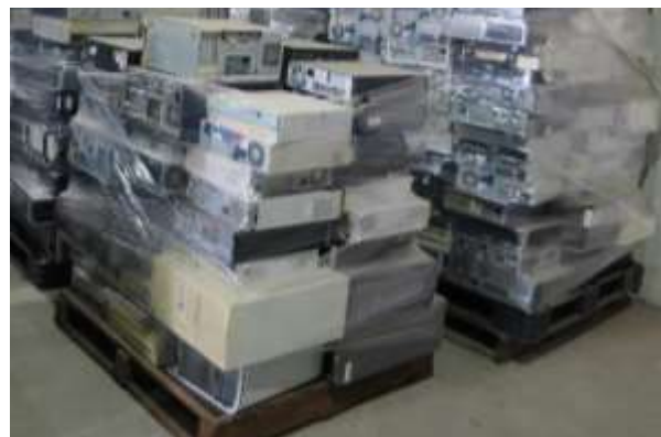
可持續使用的二手電腦