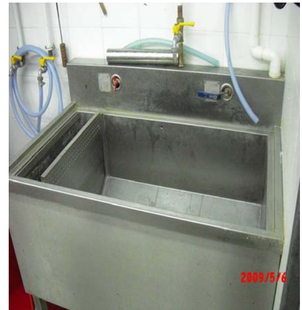
本集團採用的啤水機