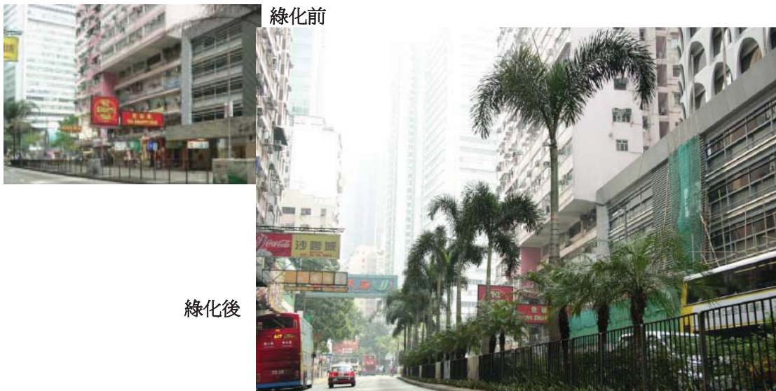
灣仔綠化總綱圖的綠化工程 — 軒尼詩道(盧押道與分域街之間)