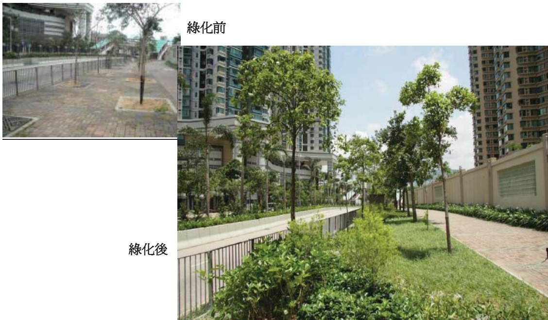
旺角和油麻地綠化總綱圖的綠化工程 — 海輝道