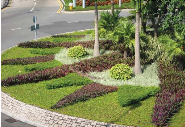
中環七號碼頭 對面的迴旋處