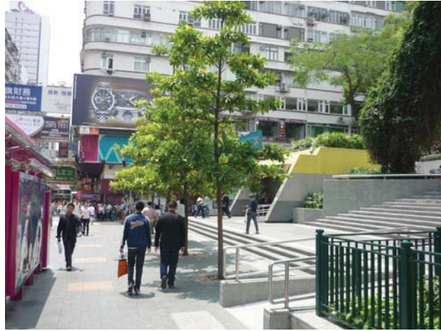
尖沙咀港鐵站旁的改善工程

區範圍，確立一個可作整體地區改善的框架。行人環境規劃圖則所建議的部份短期行人環境改善計劃經已完成，其他包括地區改善計劃的優先項目亦已於不同階段落實。此外，相關的行人環境及地區改善建議會依據現有的機制及資源分配制度逐步落實。