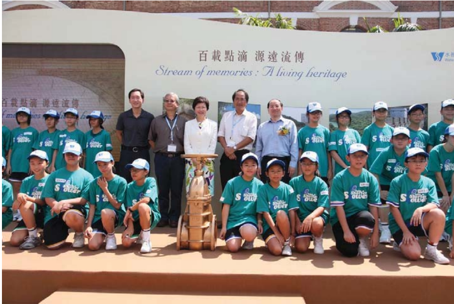
香港的水務古蹟宣布典禮暨香港區世界水監測日

法，以開發具成本效益的新水源。在非飲用水資源方面，我們已設立跨部門工作小組，探討減低再造水供應成本的各種方法，以便向上水和粉嶺居民供應再造水作沖廁及其他非飲用用途。在飲用水資源方面，海水化淡現時的成本仍高，但隨着科技進步，有關成本可望下降。我們會密切監察海水化淡技術的最新發展，作為日後擴大食水供應來源的可行方法。