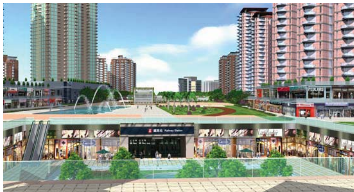
古洞北市中心模擬景色

為配合人口增長以及房屋及就業方面的長遠需要，當局建議推行發展位於新界東北的古洞北、粉嶺北、坪輦和打鼓嶺的新發展區。新發展區屬小型新市鎮，可提供土地作住屋用途和應付日後其他方面的土地用途需求。新發展區擁有便捷的集體運輸系統及社區設施，加上樓宇密度較低，可提供另一種優質生活環境讓市民選擇。新發展區的規劃及設計會根據可持續發展的原則，着重城市設計方面的考慮因素，亦會引入環保及具能源效益的措施。