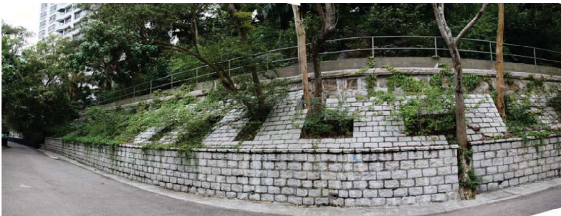
沿寶雲道的園境建築工程使該處與四周環境融為一體

為銜接「防止山泥傾瀉計劃」，我們已公布推行「長遠防治山泥傾瀉計劃」，以持續的風險管理方式，處理餘下的山泥傾瀉風險。我們會繼續致力種植花木，盡量利用植物來保護斜坡表面，並在可行的情況下保留現有植物。