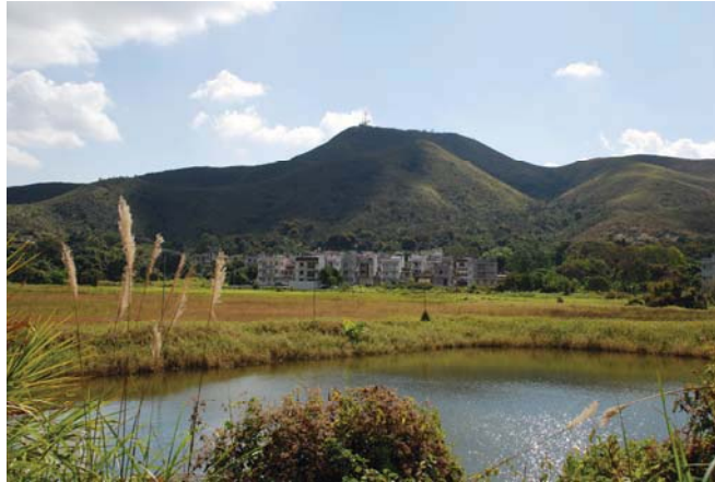
位於邊境禁區內料壆的鄉郊環境