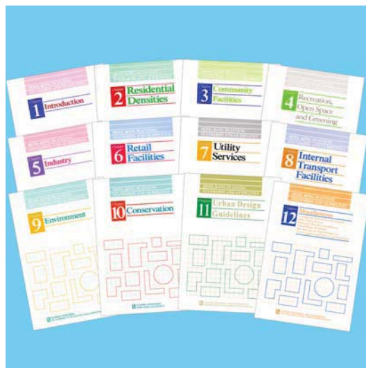
香港規劃標準與準則

《香港規劃標準與準則》共有十二章，是一份政府手冊，列明政府釐定各類土地用途和設施的規模、地點及用地需求的準則。擬備《香港規劃標準與準則》的目的，是提供特定的標準和一般性的指引，以確保在規劃過程中，政府可保留足夠土地促進社會和經濟發展，以及提供合適的公眾設施配合市民大眾的需要。《香港規劃標準與準則》除適用於發展項目外，也就環境規劃及保育自然景觀、生境、文化遺產和市景提供指引。《香港規劃標準與準則》會定期修訂和更新，以反映和配合政府政策及不斷轉變的社會需求與期望。