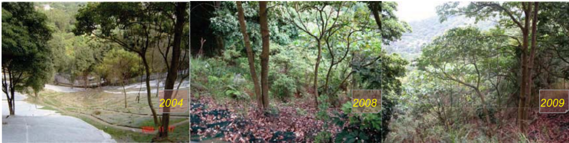
自 2004 年完成「防止山泥傾瀉計劃」下的綠化斜坡工程後的景觀變化

延續十年的「防止山泥傾瀉計劃」將於2010年完滿結束。這項計劃已鞏固超過2 900個不合標準的政府斜坡。與此同時，我們亦在斜坡種植了200多萬棵樹木、灌木和攀爬植物，令斜坡更加綠意盎然。