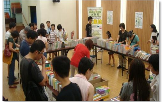
「舊書本舊校服新旅程」 書本／校服回收互換及轉贈計劃