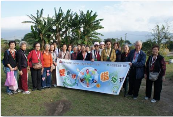
「愛地球、惜地球」計劃