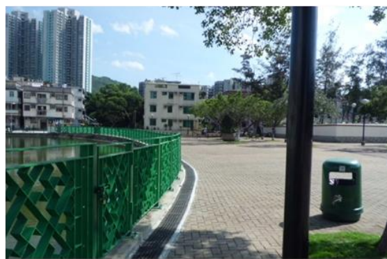
沿粉嶺圍村風水魚塘建造的大型暗渠