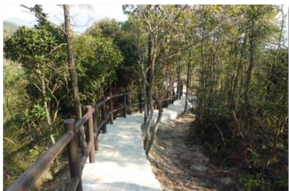
針山郊野徑上以天然石建造的行人徑

7. 本署在各地區推行小型環境改善工程，以改善區內的基礎設施及提升居住環境質素。為支持環保，我們在所有工程合約加入合適的環境污染管制條款。我們在設計工程項目時著意確保工程減少對天然環境可能造成的不良影響，以及鼓勵採用環保物料，例如以天然石建造行人徑和作為河堤的石籠護土牆等。年內，我們沿粉嶺圍村的風水魚塘建造了大型暗渠，讓魚塘排出的污水得以流入正式排水系統。