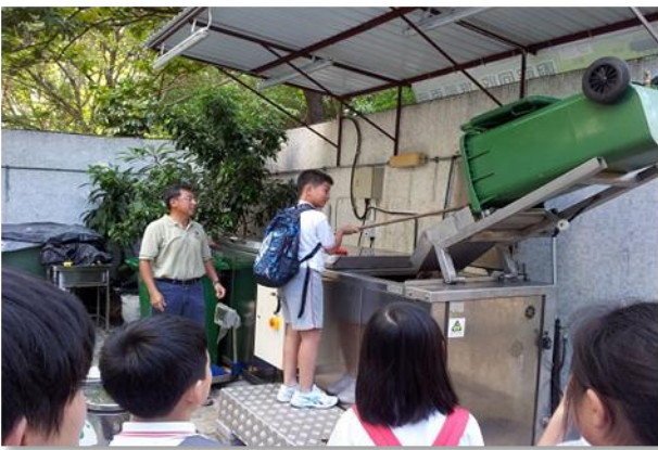
油尖旺廚餘回收校園計劃