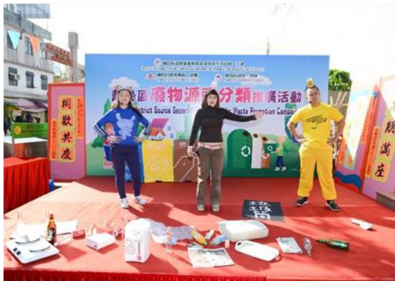
離島區廢物源頭分類推廣活動