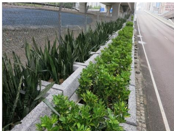
在行車天橋地帶的綠化工程