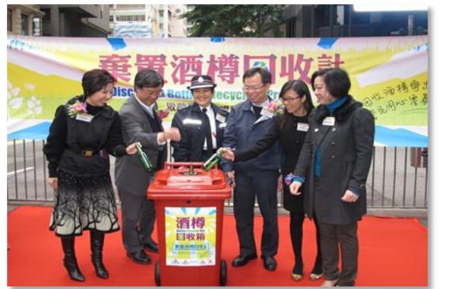
棄置酒樽回收計劃