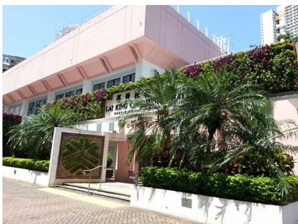
荔景社區會堂的垂直花園

11. 為了從源頭減少綠化工程所產生的綠色廢物，我們近年致力減少採用一年生植物，因這類植物需要經常更換並會製造大量園林廢物。我們將改為選用耐種而美化效果相若的多年生植物，例如灌木，以取代原有栽種的一年生植物。