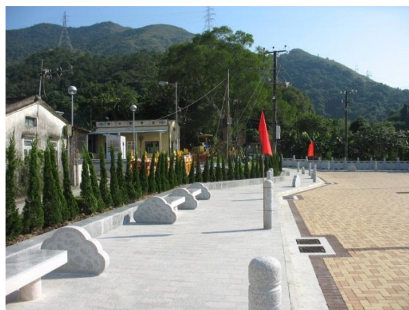
粉嶺近松嶺鄧公祠鄉村廣場 行人路旁的花崗岩標記

7. 本署在各地區推行小型環境改善工程，以改善區內的基礎設施及提升居住環境質素。為支援環保，我們在所有工程合約中均加入合適的環境污染管制條款。我們著重工程項目設計，以確保工程儘量減少對天然環境可能造成的不良影響，以及鼓勵採用環保物料，例如以天然石建造行人徑和作為河堤的石籠護土牆等。年內，我們亦在大埔頭建造樹木圍欄，並在粉嶺近松嶺鄧公祠鄉村廣場的行人路鋪設花崗岩標記作分隔，以保護本土花卉和果樹。