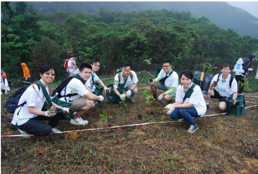
香港郵政員工在“綠野先鋒 2013”活動中種植逾 80 棵樹

在二〇一三／一四年度，我們參與多項外間機構舉辦的環保活動，包括香港公益金的“公益綠識”、環保觸覺的“香港無冷氣夜”、世界自然基金會的“地球一小時 2014”和香港地球之友的“綠野先鋒 2013”。