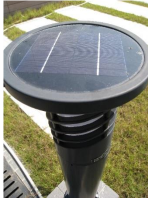
天台花園的太陽能燈

為貫徹綠色文化，部門成立綠色行動小組，負責在中央郵件中心推行多項環保措施和監察資源耗用情況。部門會定期舉行會議，檢討各項環保措施和活動的推行進度（例如擬備工作間環保資訊、張貼環保行動表及成效以肯定員工的努力），以及進一步鼓勵員工加強落實環保守則。小組與機電工程署駐場人員緊密合作，共同探討更多節能方法。