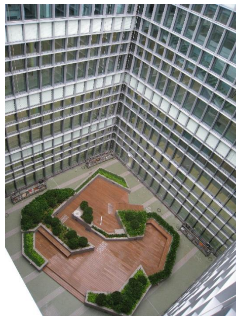
中庭及玻璃幕牆將天然光引入辦公樓層