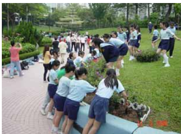
屯門區議會、屯門民政事務處和 康樂及文化事務署合辦的 屯門區迎奧運植樹日

8. 除了在地區環境改善工程計劃採取環保措施之外，我們繼續鼓勵社會各階層在地區層面進行綠化工作，並為此舉辦多項社區參與活動，讓市民共同參與，例如植樹日、園藝工作坊、綠化嘉年華、廢物源頭分類計劃、展覽、工作坊、研討會、繪畫比賽、綠化比賽、環保袋設計比賽等。