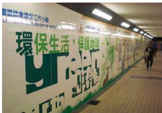
南區區議會和南區民政事務處合辦的 “環保生活·保護地球”繪畫及 漫畫設計比賽