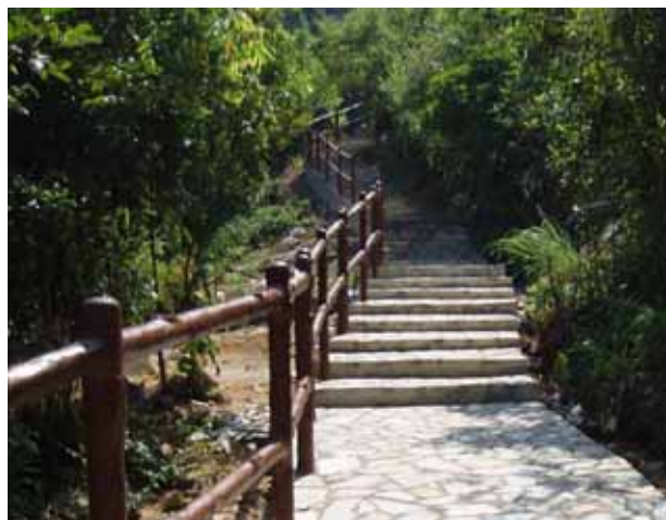
為青衣區細山郊野徑行人徑和涼亭 裝設再造塑膠欄杆