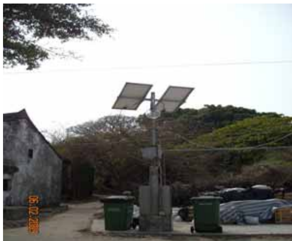
為大埔區平洲(東) 裝設太陽能鄉村路燈

此外，我們採用環保物料進行小型工程項目，例如再造塑膠欄杆，以及推行太陽能路燈計劃。