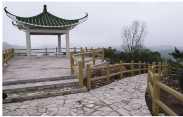
北區沙頭角吉澳三聖宮至高地頂 由天然石鋪砌的步行徑