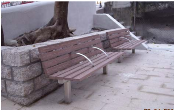
中西區山道 54-56 號休憩處 的再造塑膠板長椅

7. 本署在各地區推行小型環境改善工程，以改善區內的基礎設施及提升居住環境質素。為支持環保，我們在所有工程合約加入環境污染管制條款。此外，我們採用環保物料進行小型工程項目，例如以天然石鋪砌步行徑、採用再造塑膠板製造長椅，以及在社區中心推行更換光管計劃，以能源效益較高的光管代替 T8 光管。