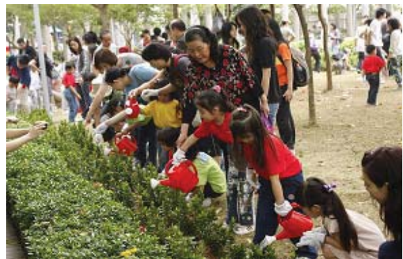
東區區議會和東區民政事務處合辦的 綠化日 2009