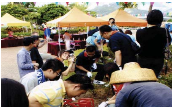
離島區議會、離島民政事務處和 康樂及文化事務署合辦的 植樹日

8. 除了在地區環境改善工程計劃採取環保措施之外，我們繼續鼓勵社會各階層在地區層面進行綠化工作，並為此舉辦多項社區參與活動，讓市民共同參與，例如植樹日、園藝工作坊、綠化嘉年華、生態旅遊、展覽、工作坊、比賽，以及廢物源頭分類計劃等。