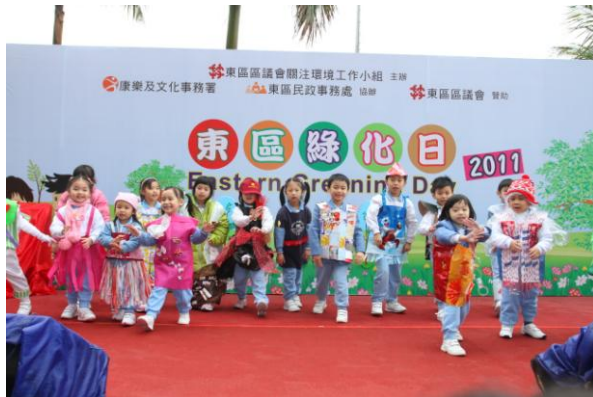
東區區議會和東區民政事務處合辦的東區綠化日 2011

8. 除了在地區環境改善工程計劃採取環保措施之外，我們繼續鼓勵社會各階層在地區層面進行綠化工作，並為此舉辦多項社區參與活動，讓市民共同參與，例如植樹日、節能措施工作坊、綠化嘉年華、生態旅遊、展覽、比賽、廢物源頭分類計劃等。