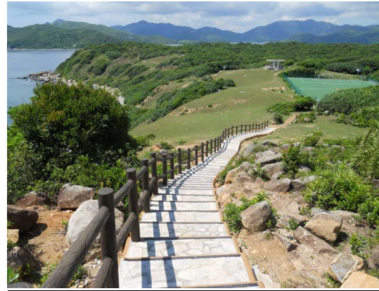
大埔西貢北塔門由天然石鋪砌的郊遊徑