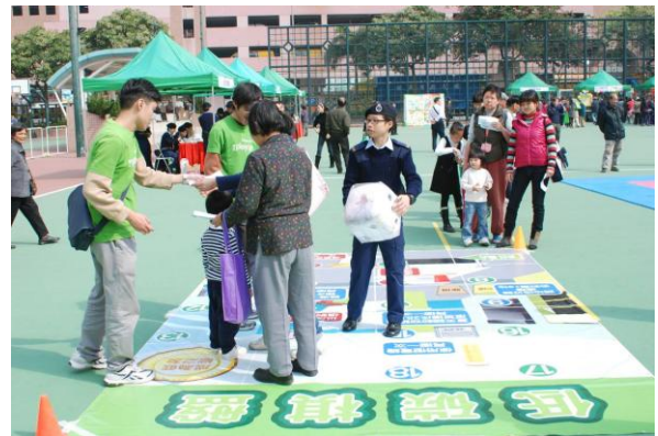
油尖旺區議會和油尖旺民政事務處合辦的“低碳生活新世代”嘉年華