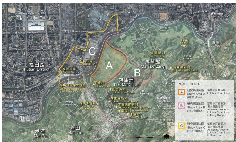
落馬洲河套地區研究範圍

由於落馬洲河套地區位於米埔內后海灣的「拉姆薩爾濕地」上游，鄰近的濕地有很高的生態價值。這項研究現正根據《環境影響評估條例》進行環境影響評估，並提出緩解措施，以確保未來發展建議符合環保標準和不會對鄰近地區現有的生態環境產生不良的影響。同時，該研究正探討在河套地區採用環保減排措施的方案。