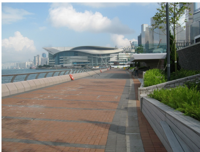
中西區海濱長廊—中環段

我們將繼續加強優化海濱的工作，並與海濱事務委員會緊密合作，以選定、策劃和進行優化海濱項目，並會在規劃及落實項目的過程中，廣邀公眾參與。