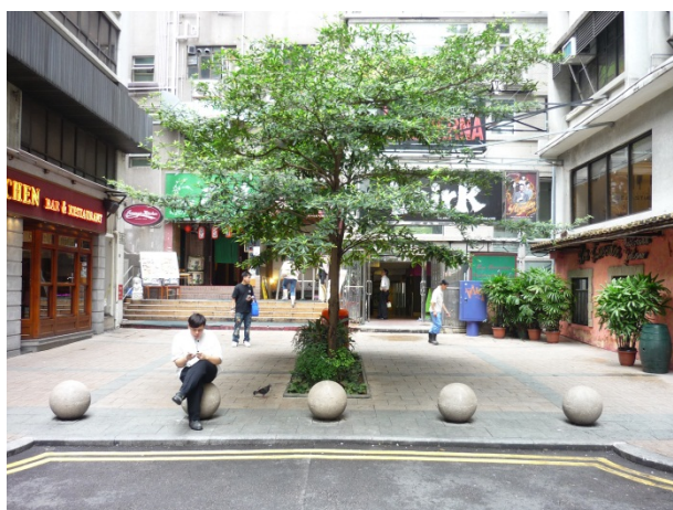
亞士厘道的園景廣場

規劃署已相繼完成銅鑼灣、觀塘、大埔墟和中區行人環境規劃圖則，以及尖沙咀和旺角的地區改善計劃，為環境擠迫的市區範圍，確立一個可作整體地區改善的框架。行人環境規劃圖則所建議的部分短期行人環境改善計劃已經完成，其他包括地區改善計劃的優先項目亦已於不同階段落實。餘下的行人環境及地區改善建議會依據現有的機制及資源分配制度逐步落實。