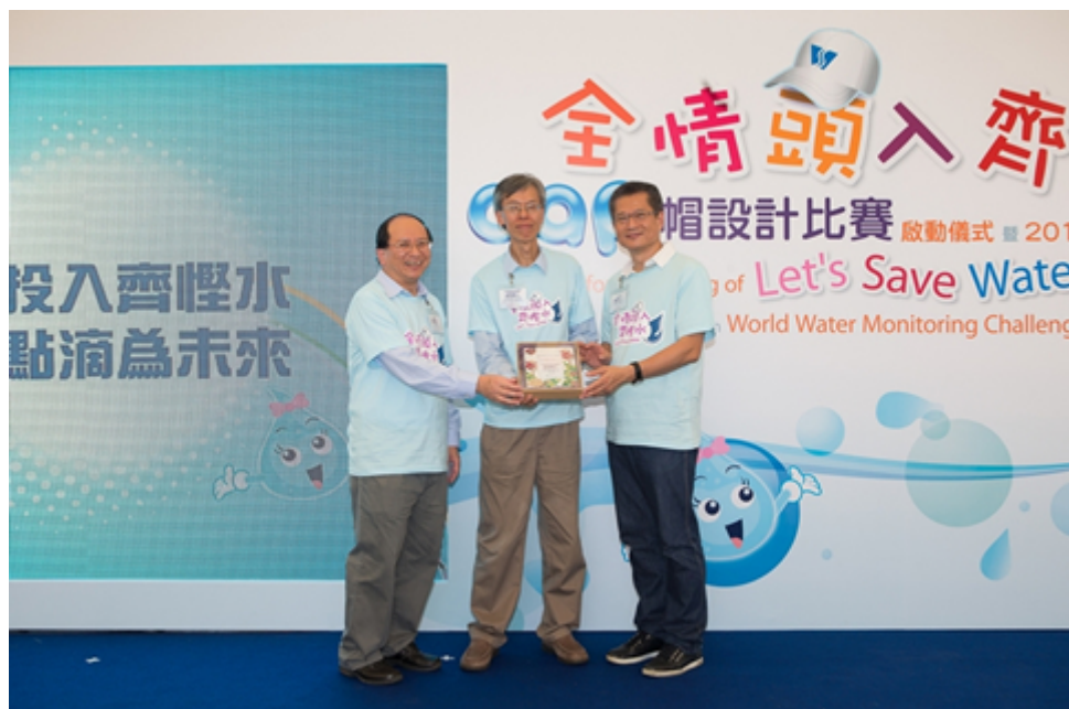
節約用水比賽啟動儀式 (攝於 2012 年 10 月 27 日大埔船灣大美督原水抽水站)

劃和勘測研究，探討在將軍澳興建一所海水化淡廠的可行性及成本效益。我們並一直研究可否向上水、粉嶺及新界東北新發展區供應再造水，以作沖廁及其他非飲用用途。我們已委聘顧問進行研究，為循環再用洗盥污水及集蓄雨水作非飲用用途訂定技術標準，顧問研究將於 2013 年年初前完成。