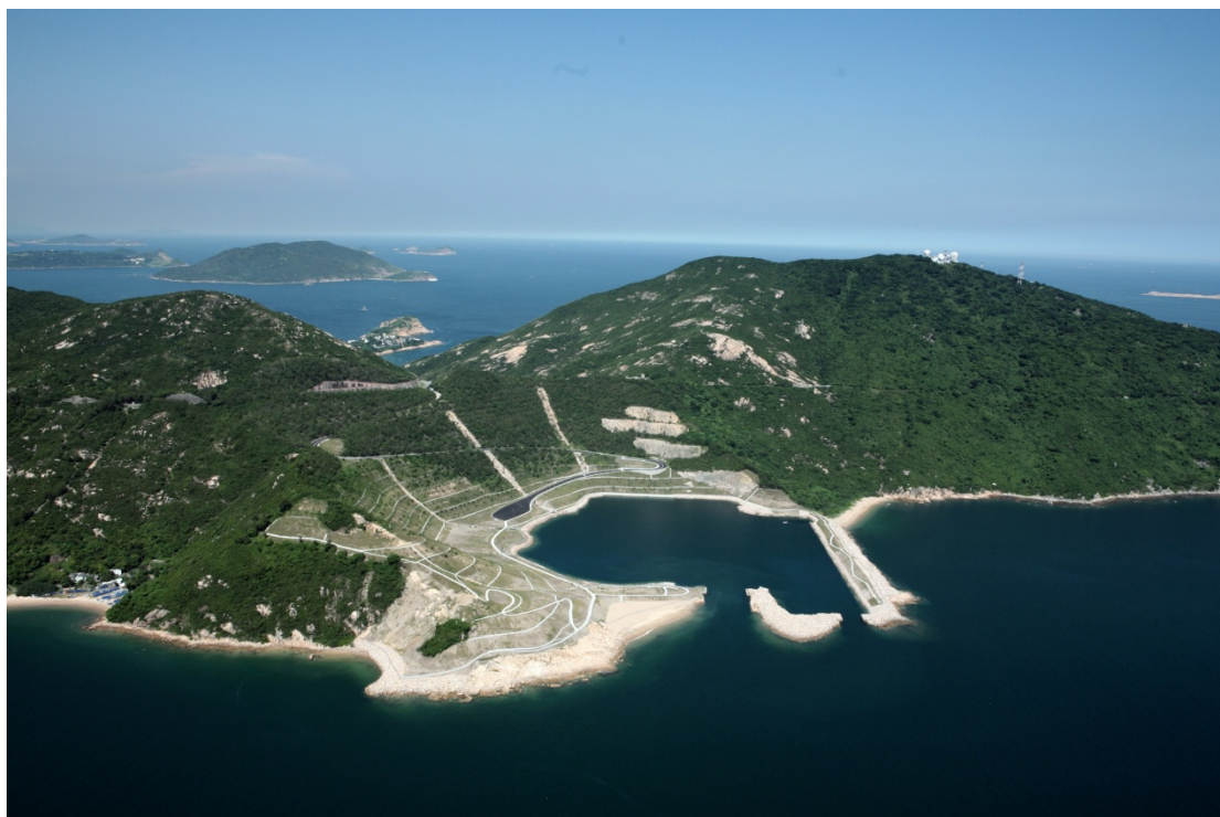
已復修的石澳礦場鳥瞰圖