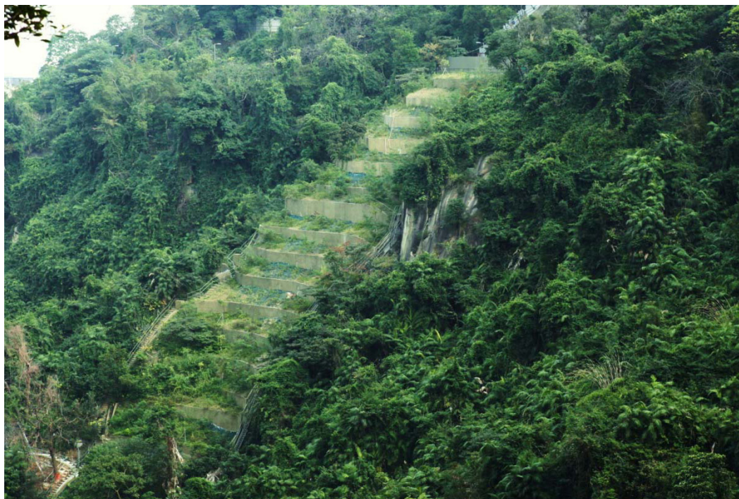
在「防止山泥傾瀉計劃」下山泥傾瀉殘痕已進行鞏固和綠化

此外，我們在進行這兩項計劃的工程時，亦種植了約 260 萬棵樹、灌木及攀爬植物，令斜坡及採取緩減措施後的天然山坡看來更自然。