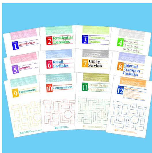
《香港規劃標準與準則》