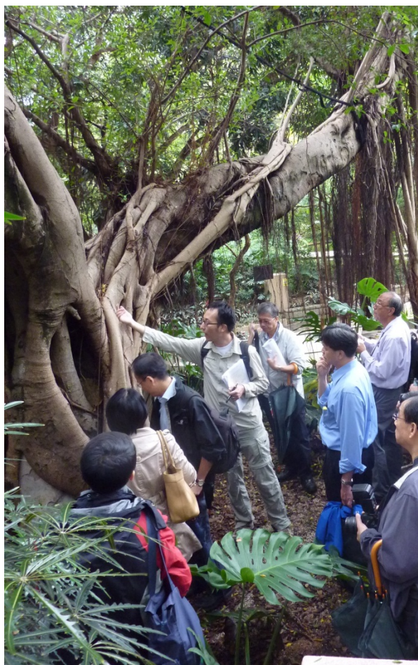
樹木管理專家小組的成員檢驗樹木

綠化、園境及樹木管理組自成立以來，一直與其他部門、區議會、學校及非政府機構合作，舉辦多元化的公眾教育及社區參與活動，在全港各區宣揚愛護植物的文化，在 2012 年共有超過 5 600 名人士參與。該組計劃於 2013 年 5 月開展全港性的「綠化伙伴運動」，旨在進一步傳揚愛護植物的信息。