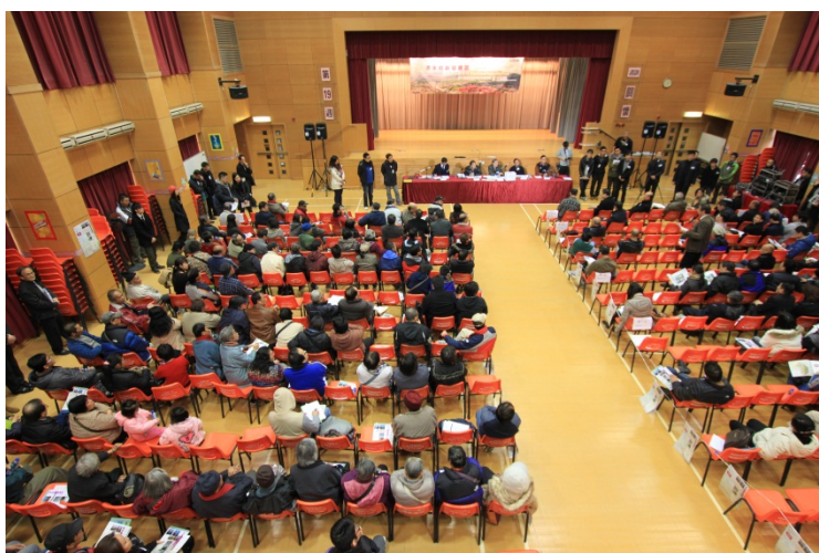
第一階段社區參與活動中的公眾論壇

洪水橋新發展區的規劃及工程研究已於 2011 年 8 月展開。該研究的第一階段社區參與活動已於 2012 年 2 月結束。所收集到的意見為草擬發展區初步發展大綱圖提供了有用的資料。就初步發展大綱圖進行的第二階段社區參與活動將於 2013 年展開。