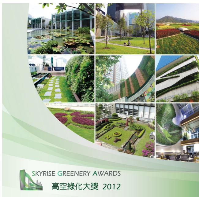
「高空綠化大獎 2012」刊物

校及非政府機構項目，以及規劃／研究項目 4 個組別。我們在 2012 年 5 月舉行的頒獎典禮上，合共頒發了 1 個金獎、9 個銀獎及 16 個優異獎。此外，我們亦印製了一份刊物，特別介紹得獎項目和概述本港高空綠化的發展情況(詳情請瀏覽綠化網頁 www.greening.gov.hk )。