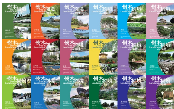
「樹木及園境地圖」內容 涵蓋全港 18 區

園境設施。除了印刷本外，綠化網頁也提供電子版本以供下載，另外亦有專供智能手機用戶使用的應用程式，以滿足不同人士的需要。