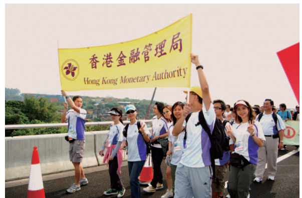
金管局職員參與深港西部通道百萬行。

年內，金管局代表隊參與多項籌款活動，包括深港西部通道百萬行及雷利衛徑長征，金管局代表隊更於後者中奪得機構組別冠軍。在5月舉行的香港紅十字會捐血日，共有47名職員參與。其他慈善活動包括公益金主辦的公益服飾日及公益行善「折」食日。