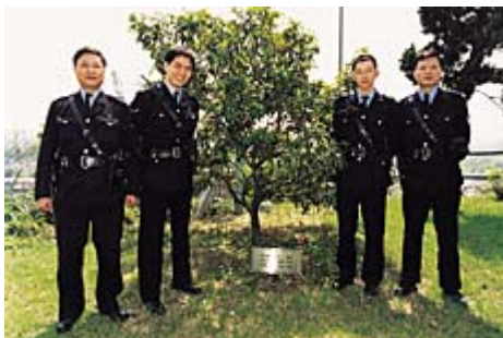
警隊亦參與改善環境工作 — 植樹。