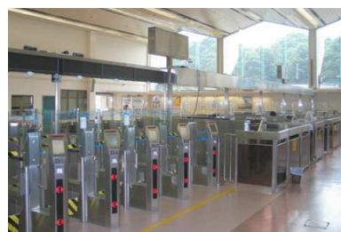
文錦渡管制站離境大堂利用窗外天然陽光照明。