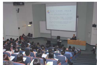
「環保辦公室與綠色生活」講座。

本處的環保政策能否成功推行，主要有賴員工的全心參與。有見及此，我們會把握每個機會提高員工的環保意識，通過舉辦講座和活動等，喚起他們的興趣及對環保措施的支持。