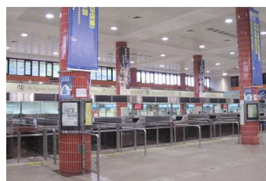
羅湖管制站新入境大堂採用具能源效益的照明裝置。

在文錦渡管制站，清晨和深夜時分的使用率相對較低，因此，我們把空調系統改為在管制站開放後半小時才開動，在管制站關閉前半小時便關上，而非如以往的一般做法，在管制站開放前半小時便開動及在管制站關閉後半小時才關上。此外，若走廊有天然陽光透過窗戶射進