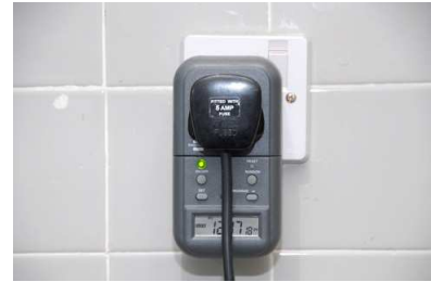
本處於辦公室的共用電器設備安裝七天定時開關掣。

兩艘服務逾 20 年的入境處工作船，已由兩艘新船「入境一號」和「入境二號」替換。由於化石燃料燃燒的過程中會產生空氣污染物氮氧化物，為了配合政府的藍天