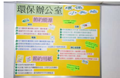
入境處總部的「環保小天地」壁報板，提高員工的環保意識。