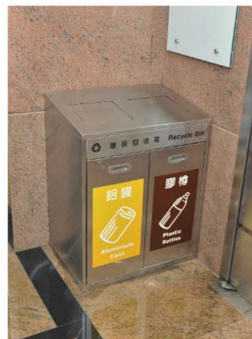
位於電梯大堂的回收箱