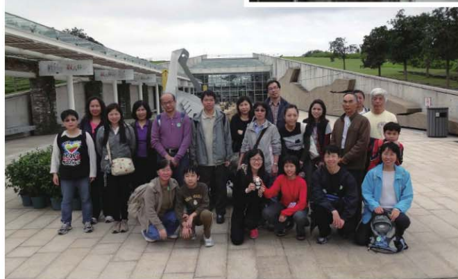
香港濕地公園及 沙頭角客家村落一日遊