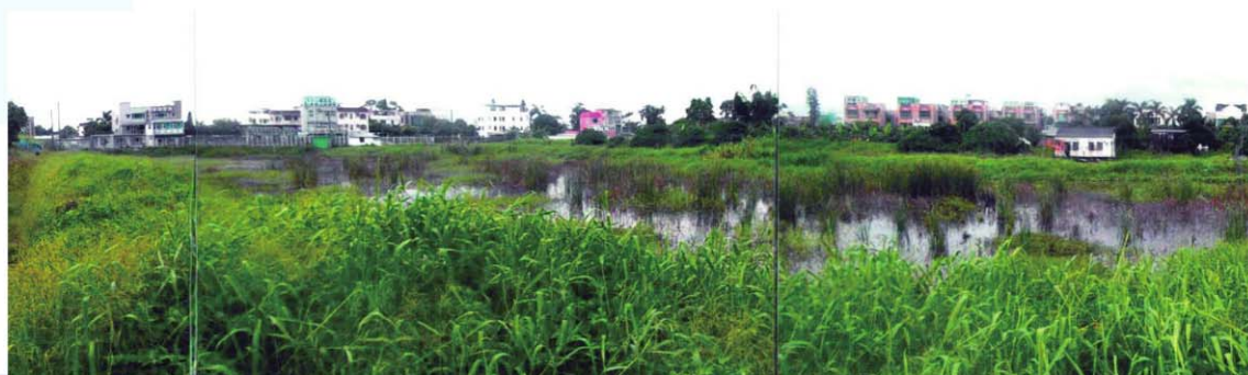
採取執行管制行動後，同一地點經清理及恢復原狀後的情況