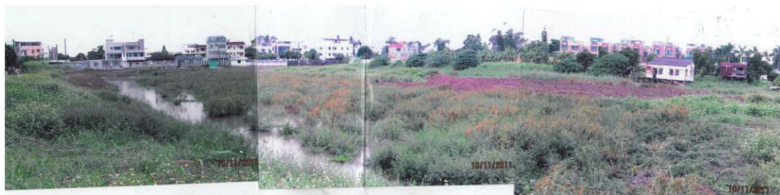
採取執行管制行動前，元朗南生圍一地點的違例填土 / 塘情況