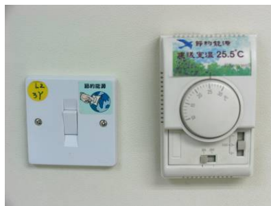
貼於電掣上的標籤，提醒職員關燈，以及在夏季時把室內溫度調校至攝氏 25.5 度

為加強同事的環保意識，香港郵政支持公益綠「識」日，以及參與鐳射打印機碳粉盒回收及廢紙循環再用等活動。