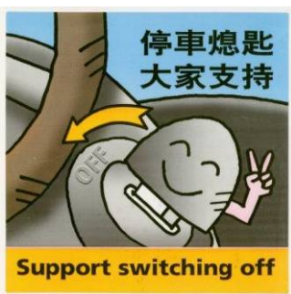
提醒司機停車熄匙的標籤

新加入香港郵政的同事會獲安排參加入職訓練課程，內容包括部門環保管理系統的介紹和節約能源的指引。除了定期傳閱內部環保指引之外，我們更積極鼓勵職員在工作上及日常生活中盡量身體力行，支持環保。