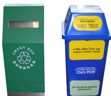
廢紙回收箱和鐳射打印機碳粉盒回收箱